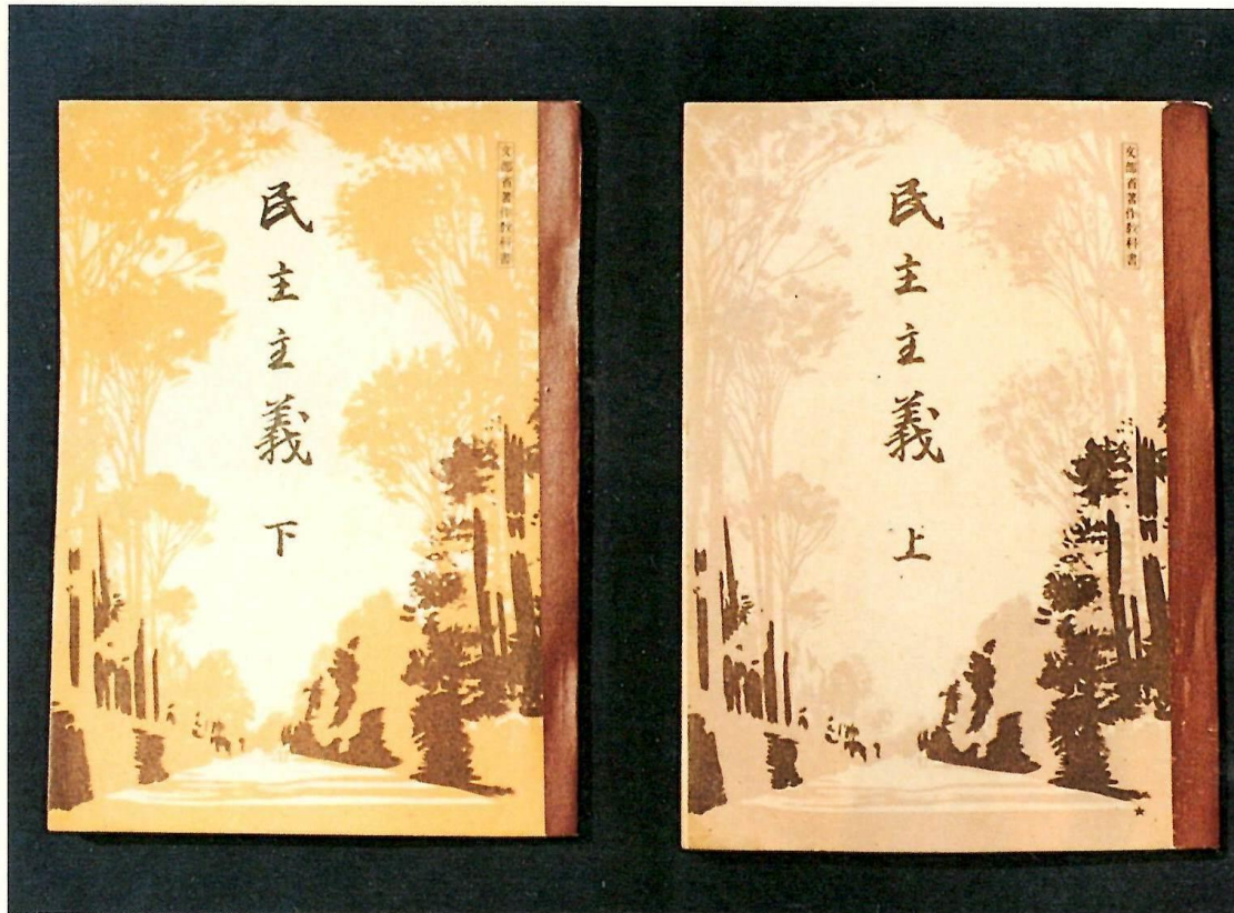
民主主義(昭和23年)文部省著作教科書