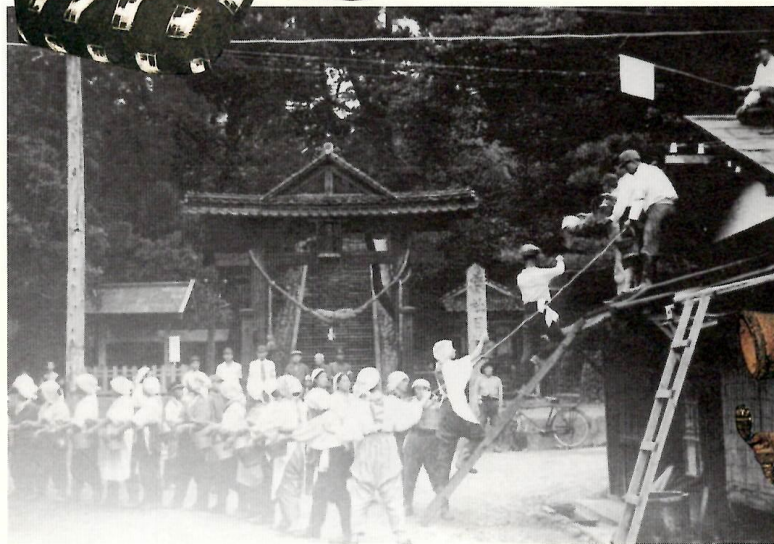
▲下台町の防空演習（昭和19年頃）