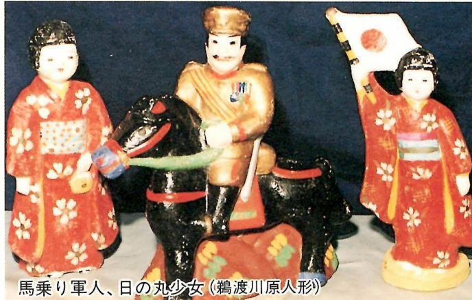
馬乗り軍人、日の丸少女（鶴渡川原人形）