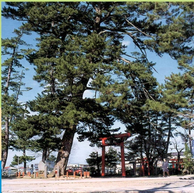
「子なさせの松」(妙法寺境内) 砂を防ぐための酒田最古の松と伝えられる