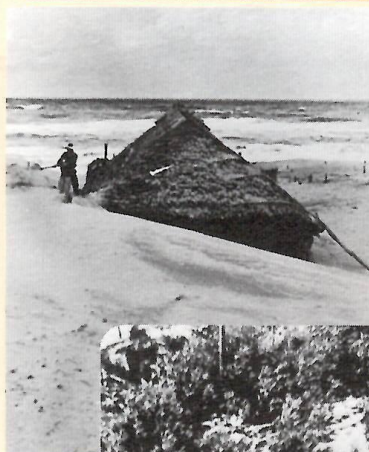
◀ 砂に埋まりそうなお家