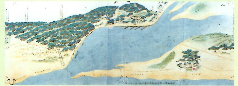
▲ 大泉海岸之図 嘉永三戌年(部分)

庄内砂丘砂防林史(一～七) … 鶴岡市立資料館所蔵 庄内平野の開発者本間光丘 … 酒田市立光丘文庫所蔵 救荒の父本間光丘翁 …………… 酒田市立光丘文庫所蔵 光ヶ丘松林沿革概要 …………… 酒田市立光丘文庫所蔵