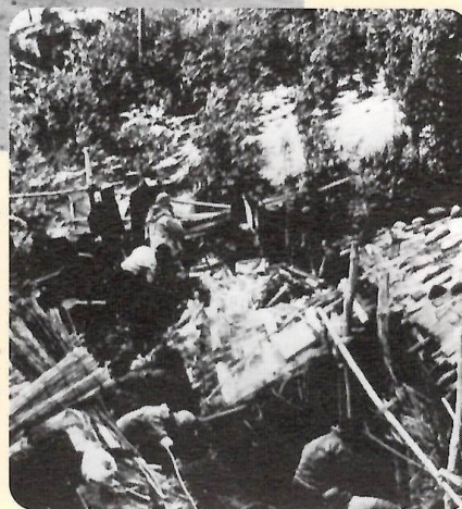
▶ 砂にこわされた家