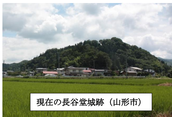
現在の長谷堂城跡（山形市）

直江兼統は、1万8,000の大軍で攻め込んできたが、志村は上杉勢を誘い込み一斉射撃を加えるなど、さまざまな策で兵を退けるのであった。長谷堂の防衛に当たる最上軍の戦力は、わずか1,300ほどである。志村らの奮戦により長谷堂城は2週間持ちこたえ、そこに「東軍勝利」の一報が入り、上杉軍は撤退を余儀なくされる。志村はこの長谷堂城での活躍により、名将として評価される。