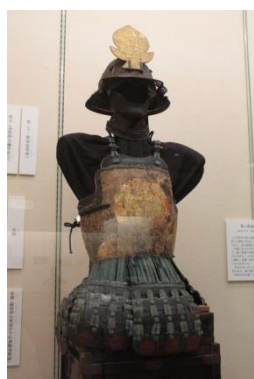
酒田市指定有形文化財 革包日の丸 丸胴具足