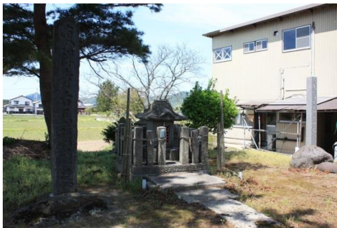
東禅寺右馬頭の墓

東禅寺兄弟の弟、右馬頭の墓は十五里ヶ原古戦場にひっそりと建つ。そばにある塚は、討死した兵の首塚であるという。