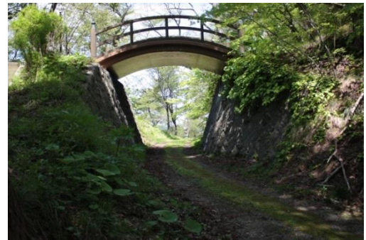
尾浦城跡（鶴岡市大山公園）

平田地区の中心地にあり、一部土塁の遺構と、復元された櫓・跳ね橋がある。ここを拠点とした砂越氏は、武藤氏と同程度の勢力を持ち、庄内の覇権をめぐって争った。廃城となってからは諏訪神社を本丸跡に置き、ほかは農地として利用され、現在は城址公園として整備されている。