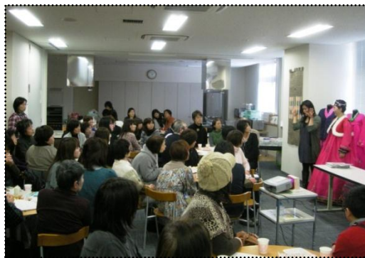
↑ 会場の様子。大盛況でした。