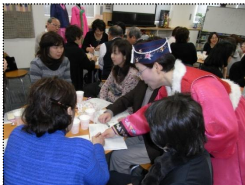
↑ ハングルで自分の名前を書いてみる