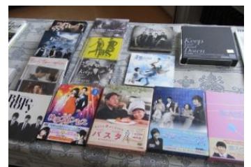
↑ 韓国の書籍やDVDの展示