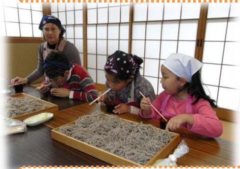
美味しいそばの出来上がり☆