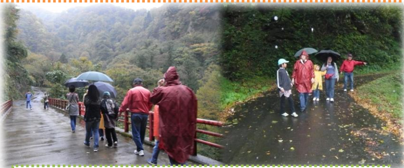
その後、十二滝にも寄りましたがあいにくの雨・・・