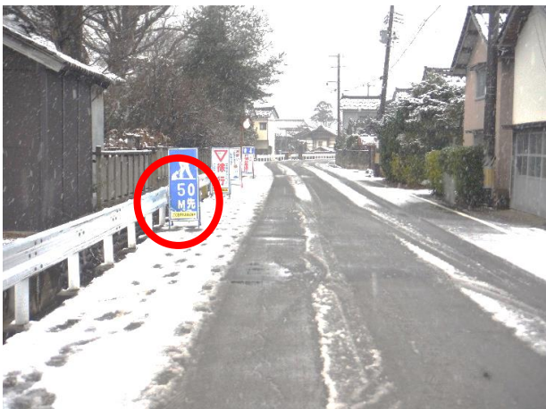
× 工事予告看板の距離表示が合っていない 予告看板の距離表示が実際の工事箇所まで距離と合っていない。