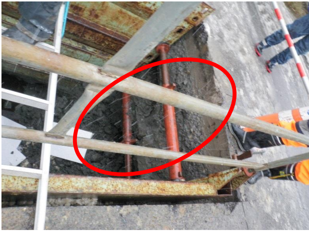
× 掘削現場で簡易土留板の未設置 掘削現場で簡易土留板が設置されていない面があり、法面が崩れる危険性がある。