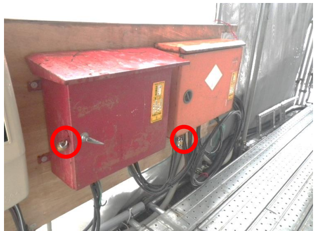
○ 工事用の電源盤に鍵が掛けられている。 工事用の電源盤にそれぞれ鍵を掛けて、安全管理を行っている。