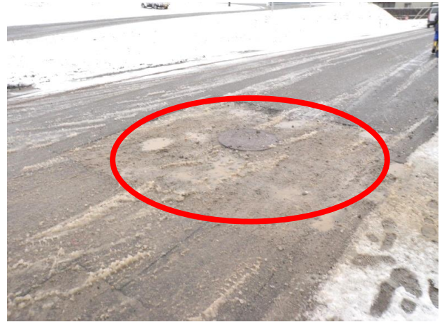
× 復旧箇所の凸凹が大きい 復旧箇所（仮復旧も含め）で凸凹が大きい箇所がある。