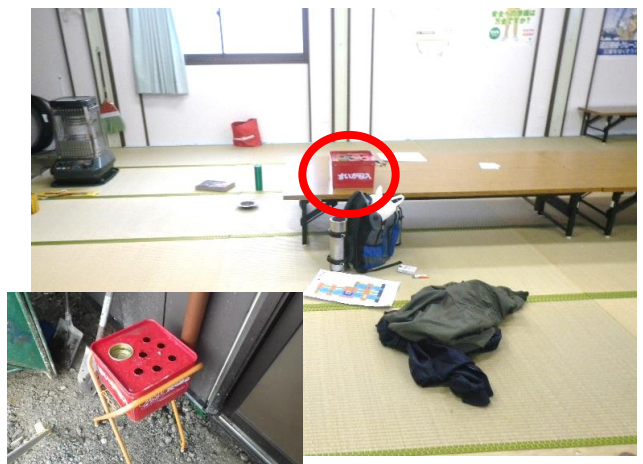
× 休憩室に吸殻入れが置いてある 屋外に喫煙場所が設置してあるにもかかわらず、休憩室内にも吸殻入れが置いてあり、分煙が徹底されていない。

今年度の安全点検は今回を持って終了の予定です。来年度も発注状況を踏まえ適宜開催いたします。なお、3月には平成29年（1月～12月）に完成検査を実施した工事を対象として、優良企業（現場代理人等）表彰を実施する予定です。