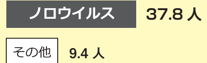
食中毒1件あたりの患者数