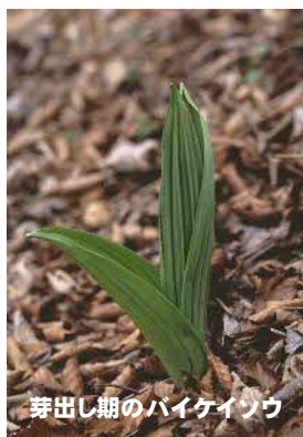
芽出し期のバイケイソウ