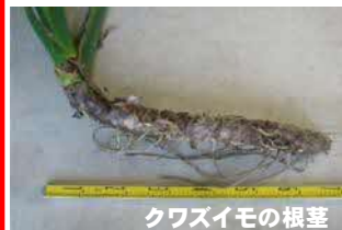
クワズイモの根茎