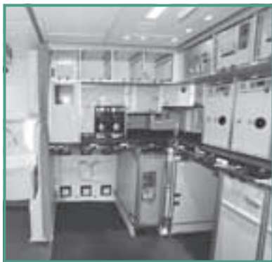
ボーイング787のギャレー