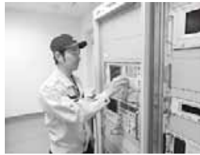
ノイズ測定中です！