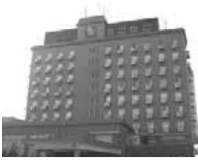
ホテルリッチ&ガーデン酒田