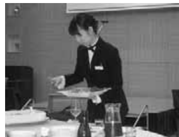
パーティーの料理サービス