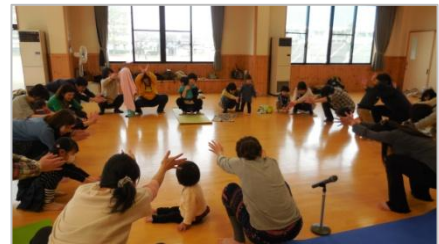
（ベビーマッサージを楽しむ会）

お母さんが笑顔でなければお子さんも笑顔になれません。昔から伝わる暮らしの中には、どちらもいい笑顔にいるための知恵がたくさんあります。これからも、会のメンバーと共に伝えていきたいと思えます。