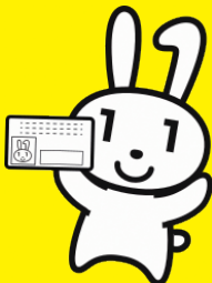
マイナンバーPRキャラクター マイナちゃん