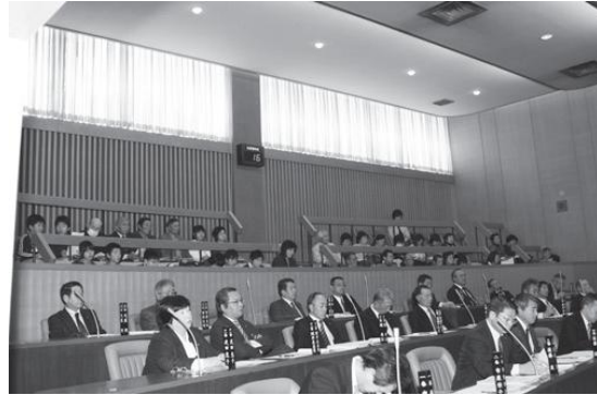
手前が議員、奥が傍聴する市民