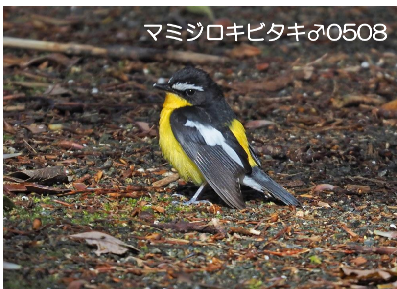
マミジロキビタキ♂0508