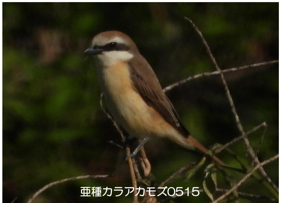
亜種カラアカモズ0515