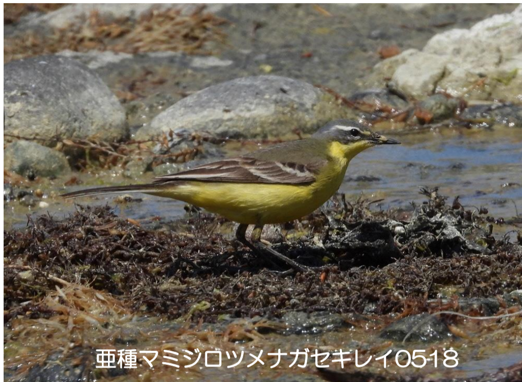
亜種マミジロツメナガセキレイ0518