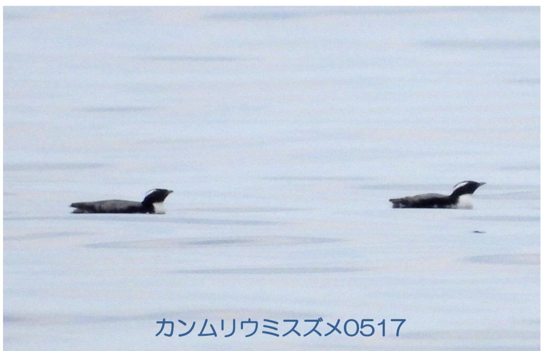
カンムリウミスズメ0517