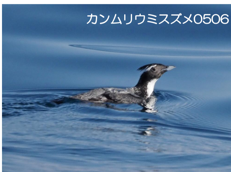
カンムリウミスズメ0506