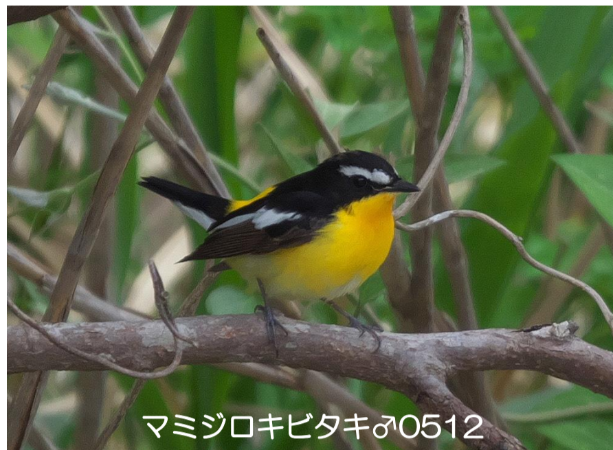
マミジロキビタキ♂0512