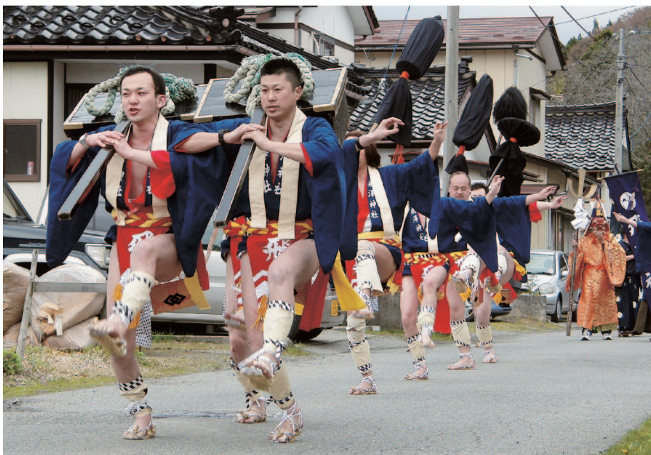
「飛澤神社例祭の奴振り」 ～八幡・観音寺地区～