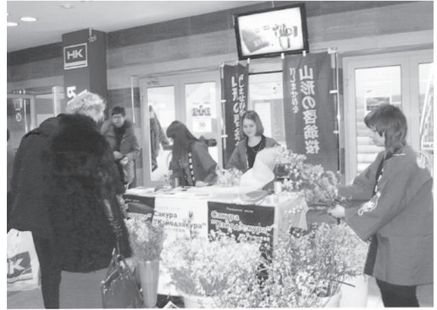
ハバロフスク エンカシティでの販売の様子