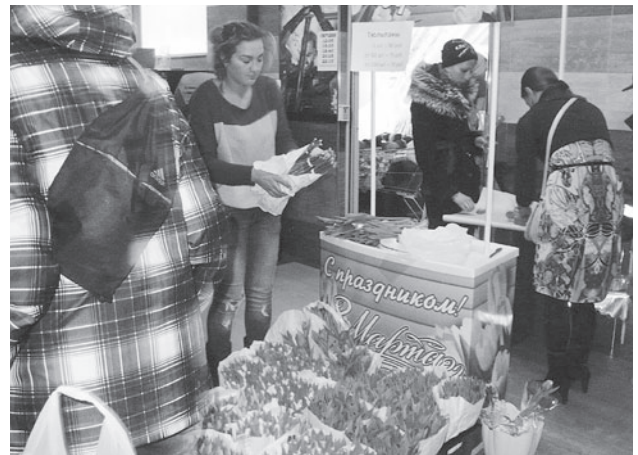
オランダ産 チューリップの販売風景