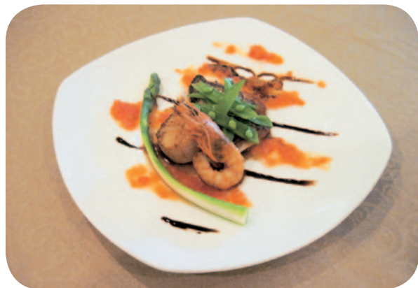
真鯛のポアレ・バルサミコとトマトソース