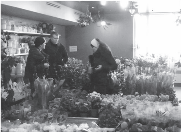
ウラジオストク マジックフラワー店内