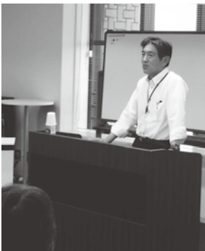
粘り強い働きかけがカギ!