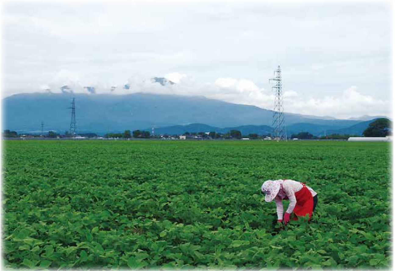
「うんめえ枝豆、届けっさげの〜」(上田地区)