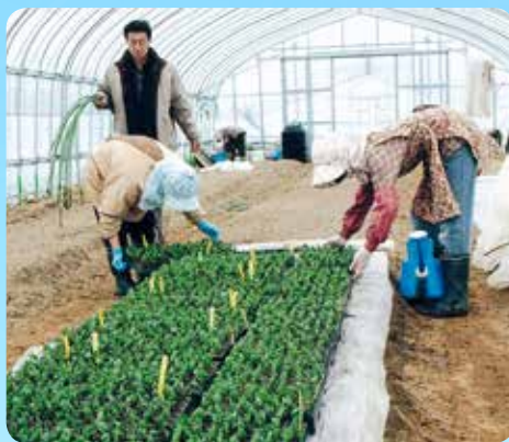
主な農産物 米、大豆、枝豆、花卉

しつつ、後継者育成につながるよう経験や勘に頼る農業からの脱却、栽培マニュアルを作り初心者でもすぐにできる農業。