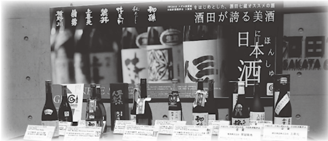
「酒田が誇る美酒」の展示 <酒田市役所>

全国の自治体名の文字に「酒」の文字が入るのは2つだけとのこと。酒田市は、食べておいしい「米」どころ。そして、飲んでおいしい「酒」どころなのです。