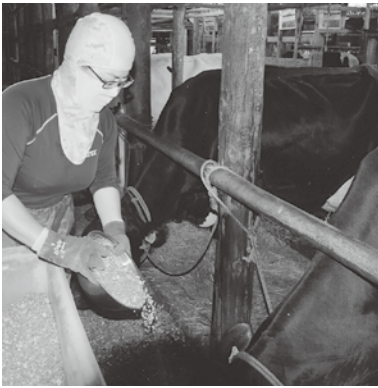
キチンとした仕事ぶりが評判です

今後の課題は、変則勤務で体調を崩しやすいので、休日にきちんと回復するようにすること。そして農家さんからの依頼も以前より増えた気がするので、できれば養豚の臨時ヘルパーさんもいてほしいなあと心から願っております。