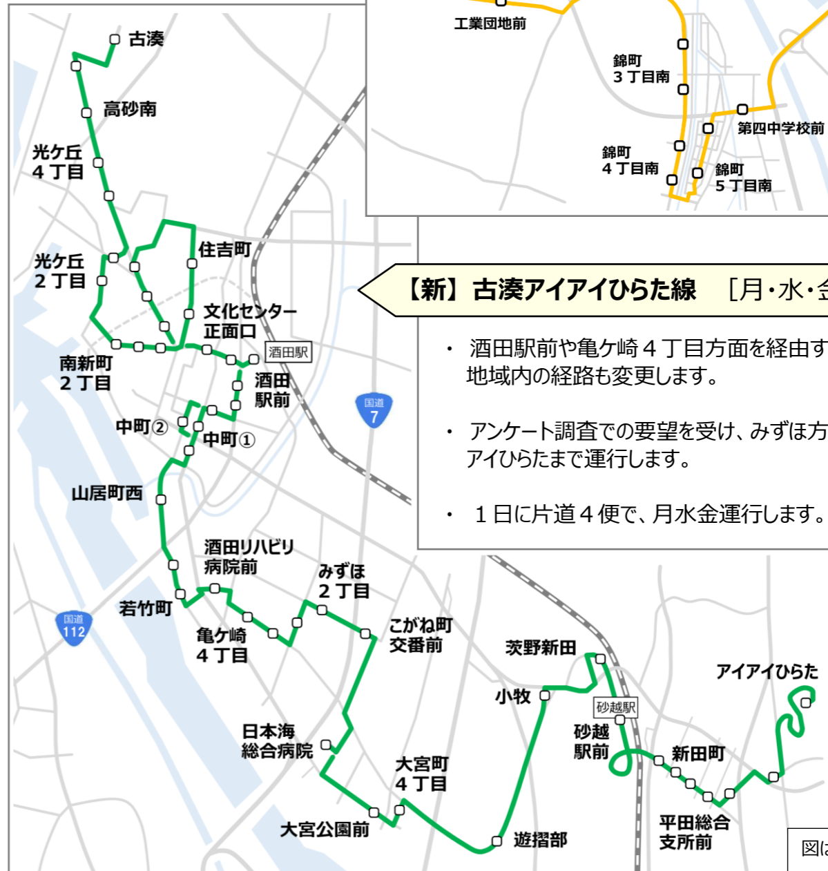
図はイメージです