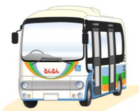
図はイメージです