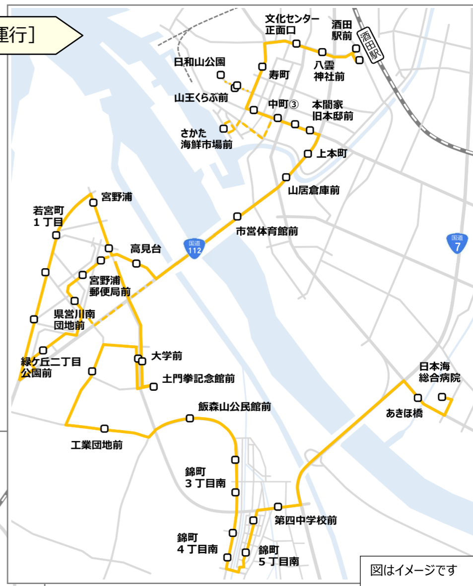
図はイメージです