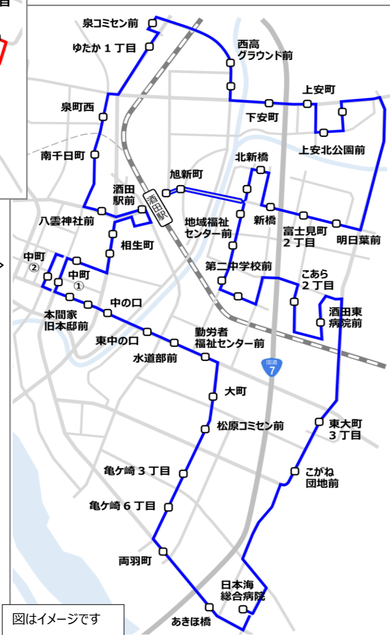
図はイメージです