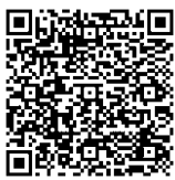
▲アンケートフォーム

対象／市内在住の20歳以上の方▼回答方法／7月30日(金)まで左記二次元コードを読み取るか、市ホームページから回答