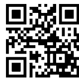
▲同教室ホームページ

日時/8月8日(祝)午前9時～10時 ▼場所/光ヶ丘屋内プール▼対象/小学生と保護者▼定員/30組▼内容/【小学生】水慣れ、クロール【保護者】水泳、アクアウォーキングのいずれか▼費用/1組2千円、1人追加につき1千円(当日徴収) ▼申し込み/8月6日(金)まで同教室ホームページ内専用申し込みフォームに必要事項を入力 同教室 ☎33-0167