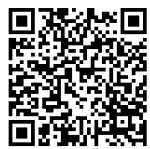
▲やまがたe申請 酒田市電子申請 サービス