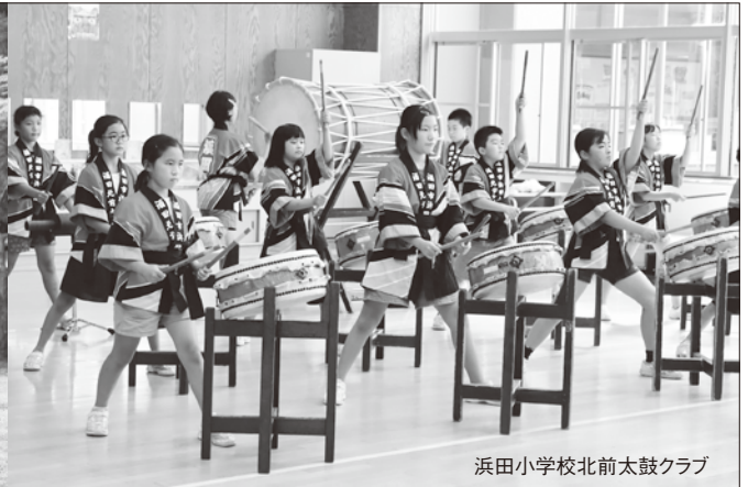
浜田小学校北前太鼓クラブ