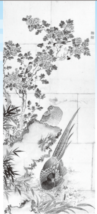
粉本「花鳥図」(紙本着色)