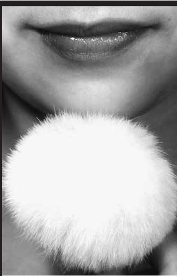
土門拳《皮膚に関する八章 第一章 触感》/1948年