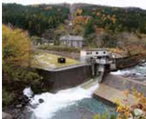
▲鳥海山麓の黒瀬水力発電所

工芸、水車などの施設のほか、水に関わる生活様式や子ども水遊びなども含まれます。鳥海山地域や飛島でも、多様な水文化を見ることが出来ます。例えば、遊佐町の丸池様のように水域を信仰の対象にしたり、秋田県にかほ市の温水路のように農業に利用したりしています。皆さんが暮らす地域にどのような水文化が培われてきたかを見直すことで、地域への理解と愛着を深めることができるでしょう。