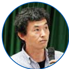
秋田大学教育文化学部 教授