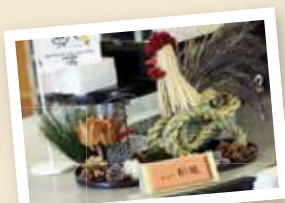
記載台の上には 地域の方が作製した今年の干支 の置物があります。