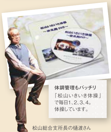
体調管理もバッチリ 「松山いきいき体操」 で毎日1、2、3、4。 体操しています。