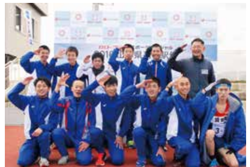
▲優勝を勝ち取った山形県高校駅伝競走大会