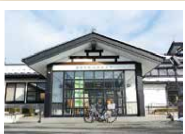
松山総合支所正面入口 和風で端正なたたずまいの同支所。

城下町の風情が漂うまち 松山総合支所とその周辺の施設は、白壁に瓦屋根の建物が多くあり、落ち着いた町並みになっています。