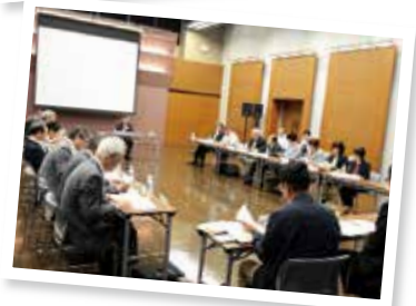
▲総合計画審議会の様子