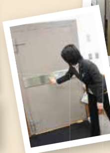
金庫が書庫に变身 元金融機関を増改築した松山総合支所。当時の名残りの金庫があります。現在は書庫として使用。