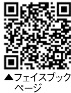
▲フェイスブックページ