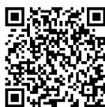
▲酒田市公式 Facebook ページ QRコード

Facebookとはインターネットを活用したSNS(ソーシャル・ネットワーク・サービス)の一つで、氏名やメールアドレスなどを登録するだけで誰でも使える無料のサービスです。