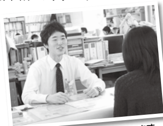
いつも親身になって対応しています (子育て支援課・行政)