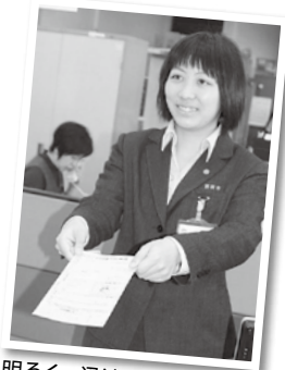
明るく・迅速・丁寧を心掛けています (市民課・行政)

平成26年4月1日採用の職員採用試験を実施します。税や福祉、政策企画など、行政事務全般の業務に従事する行政職と、工事の設計や施工管理、施設の維持管理などに従事する技師職が対象です。