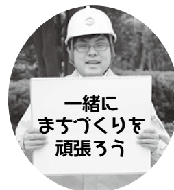
▲未来の同僚へメッセージ

【お詫び】 本紙6月1日号の酒田まつり写真特集内の写真説明文「県立酒田光陵高校の若さ溢れる踊り」は「魁まつり塾塾生の若さ溢れる踊り」の誤りでしたのでお詫びして訂正します。