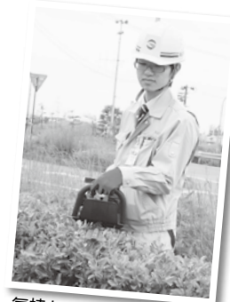
気持ちよく公園を利用してもらえるように、緑の環境を整えています (都市計画課・技師)