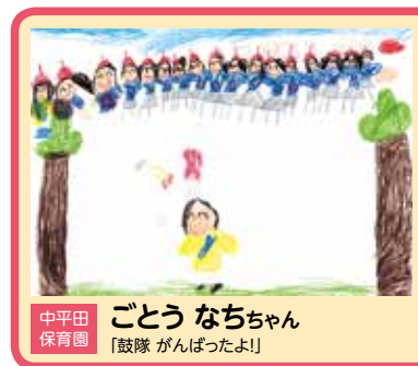
中平田 鼓隊 がんばったよ! 保育園