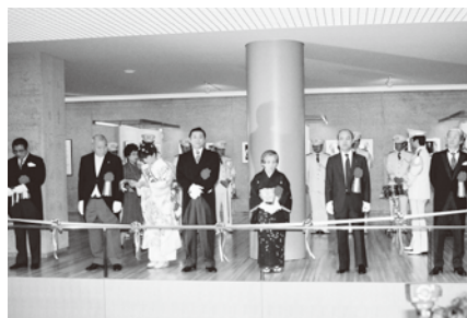
S58.10.1土門拳記念館オープン式典