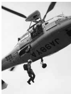
【9/2升田】 山岳救助合同訓練