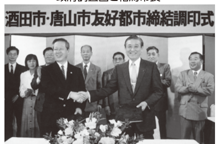
H2.7.26中国唐山市との友好都市締結調印式