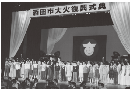
S54.5.19酒田市大火復興式典