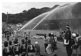
【8/30飛鳥】災害救助訓練