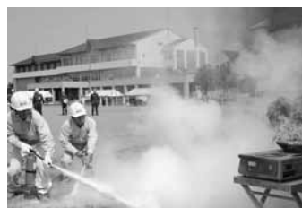
【9/7飛鳥】総合防災訓練