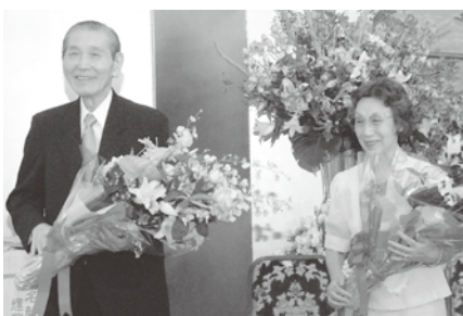
H20.7.26旭日中綬章・叙勲受章祝賀会