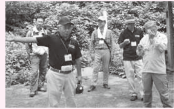
▲飛島ガイド養成講座の様子

も予定しているので、アイデアをどんどん出してほしいな。それに、例えば自家用車の使用を控えて二酸化炭素排出の抑制を心掛けるなど、自然や環境に優しい生活を送ることも大切だね。