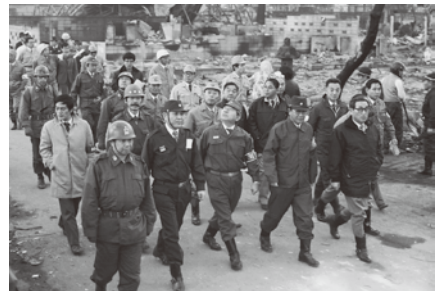
酒田市大火後、林消防長官を団長とする政府調査団と相馬市長