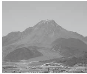
▲平成新山(島原半島ジオパーク)

ジオツーリズム(ジオ(地球)に親しみ、ジオを学ぶ旅)を楽しむ場所。日本国内では36のジオパークが認定されていて、その中でも山陰海岸、島原半島など7地域は、世界ジオパークネットワークによる、より厳しい基準の審査を経て、世界ジオパークに認定されているんだ。