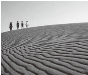
▲鳥取砂丘(山陰海岸ジオパーク)