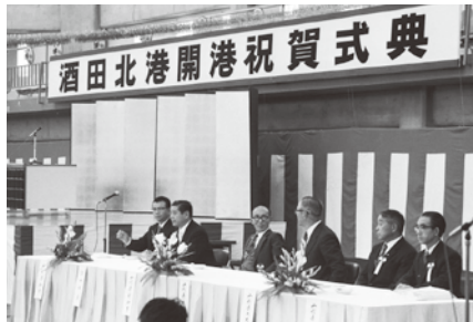
S49.11.1酒田北港開港祝賀式典