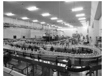
鳥海工場の製造ライン