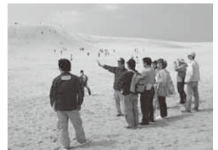
▲ジオガイドによるツアー (山陰海岸ジオパーク)

※エコツアー/自然環境や、歴史・文化などを観光の対象としながら、その持続可能性を探る旅行