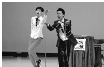
▲11月16日ひらたタウンセンターでの公演の様子

「芸人になって辛いとか苦労した と思ったこと はないです ね。銀行を 退職して収 入は半分に 減りました が」と笑顔で 答えます。