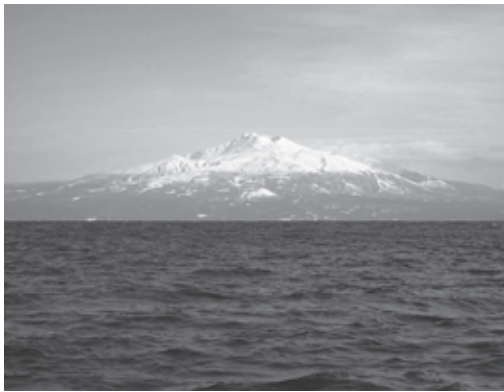
▲日本海(対馬暖流)と鳥海山

国土交通省によると、日本の国土の半分以上が「豪雪地帯」でそこには、日本の人口の約15割の人々が暮らしているそうです。鳥海山・飛鳥ジオパーク構想の位置する秋田県と山形県も全域が豪雪地帯で、一部にさらに雪の多い「特別豪雪地帯」を含んでいます。