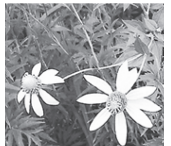
▲オオハンゴウソウ