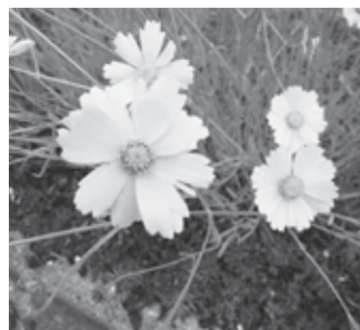
▲オオキンケイギク

特定外来生物の栽培、運搬などは原則禁止されていて、違反した場合には罰則が科せられます。市内でも空き地や道路沿いなどによく見られる植物(オオキンケイギク、オオハンゴウソウ)があります。