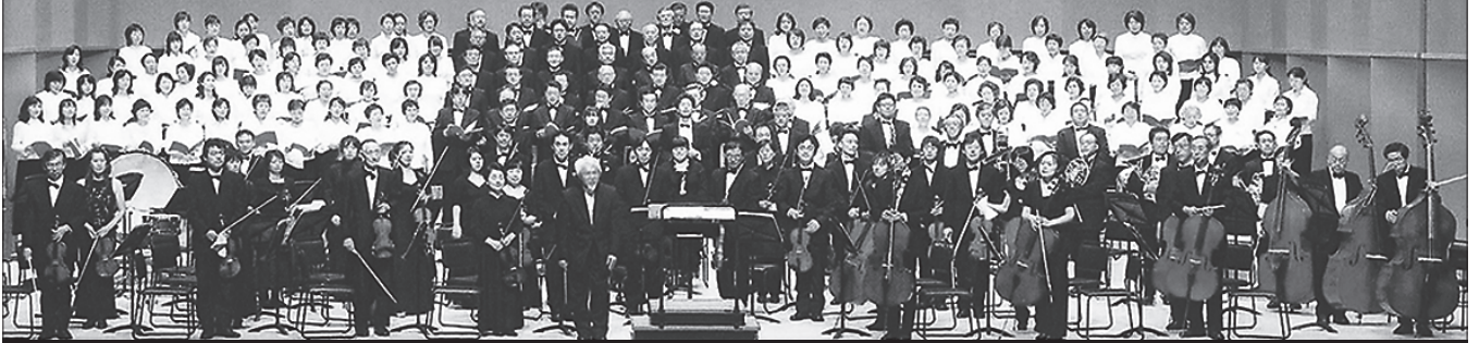
酒田市民芸術祭実行委員会事務局 ☎26-5450