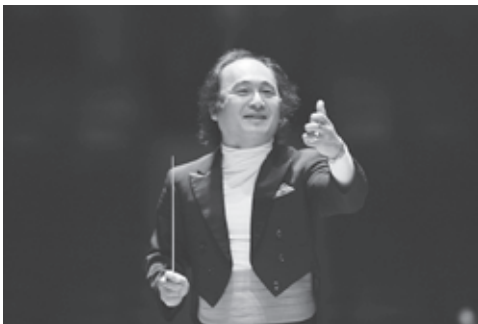
【指揮】広上淳一