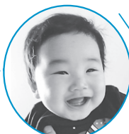
たかいたかき だーいすき!