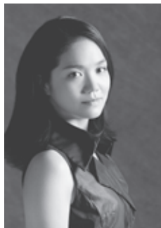
【ピアノ】河村尚子