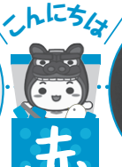
暑くても毎日 元気いっぱいだよ!