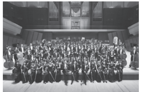
【オーケストラ】新日本フィルハーモニー交響楽団