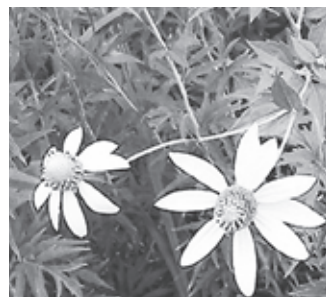
▲オオハンゴウソウ