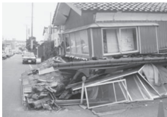
◀新潟県中越沖地震（平成19年）で倒壊した家屋

本市では、平成12年5月31日以前に着工された木造住宅に対して耐震診断士派遣事業を行っています。これまでに174件の耐震診断を行い、約9割の住宅が地震に対して危険性があると判定されています。建築士による耐震診断を受け、家の強さを確認しましょう。