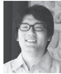
鳥海南麓自然保護官事務所 自然保護官