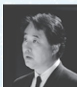
▲前酒田市長 阿部寿一氏