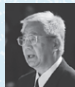
▲山形県市長会会長・山形市長 市川昭男氏