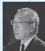
▲庄内開発協議会会長・鶴岡市長 櫻本政規氏