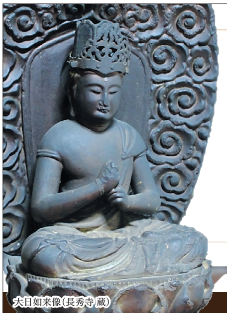
大日如来像(長秀寺蔵)