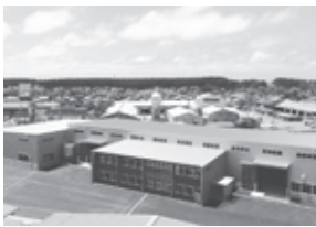
本社工場(平成27年7月竣工)