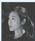
▲衆議院議員 加藤結子氏