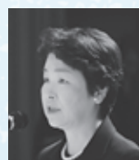
▲山形県知事 吉村美栄子氏