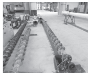
スクリューコンベヤー

メンテナンスのため分解し、軸の歪みを矯正します。機械化できない、職人の経験と感覚が頼りの作業です。