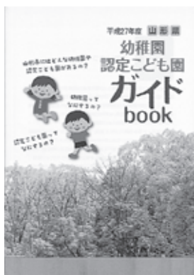
▲各園の特色や様子が一冊に

各園に関する情報は、交流ひろばや市子育て支援課の窓口で配布する幼稚園・認定こども園ガイドブックや各園のホームページ（アドレスは表1参照）をご覧ください。