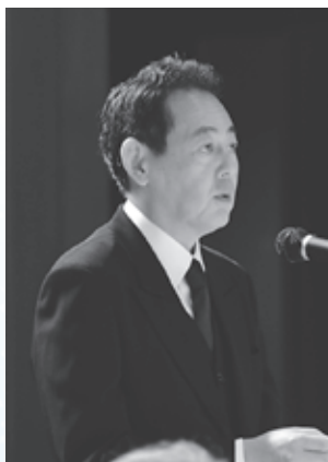
▲葬儀委員長による告別の辞