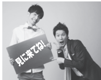
▲キャラメルマシーン