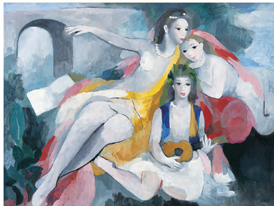
「三人の若い女」1953年頃 マリー・ローランサン美術館蔵

時間/午前9時~午後5時(入館は午後4時30分まで) 観覧料/一般1,000円、高校・大学生500円、中学生以下無料