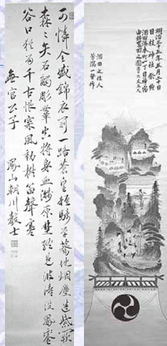
酒田祭典之図 双幅のうち左幅 (明治) (右) 伊藤鳳山 七言律詩 (江戸期) (左)