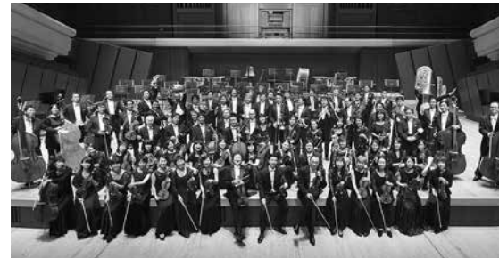
▲新日本フィルハーモニー交響楽団