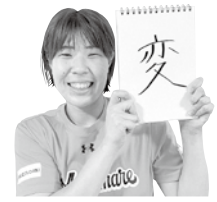
石盛めるも選手(#12) セッター