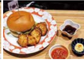
洋のプレート (ホッケバーガーとナゲット)

12月10日(日)月のホテルのレストランで2つのメニュー各50食を提供。2年生の生徒も協力し、調理、接客、会計と事前に決めた役割分担で作業を進めました。開店時間には15人ほどの方が並んでおり、その後も多くの方が料理を堪能しました。高校生から料理の説明を聞いて興味をもった方の姿もあり、料理は全て完売。生徒たちは、ほっとした笑顔を見せていました。