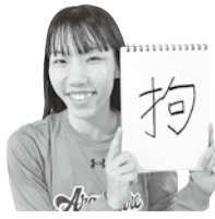
有菌未也美選手(#19) リベロ