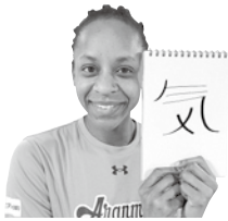
メノマチ選手(#1) アウトサイドヒッター