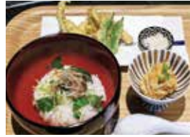
和のプレート (エソのみそ玉茶漬、ノロゲンゲの天ぷら、ホッケの南蛮漬)