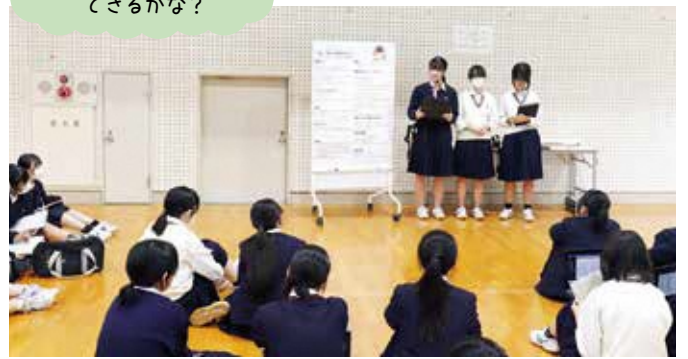
▲酒田東高等学校2年生の探究学習発表会の様子。