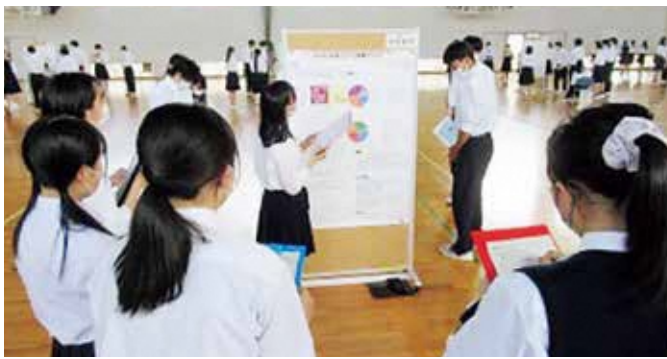
▲酒田西高等学校3年生の探究学習発表会の様子。