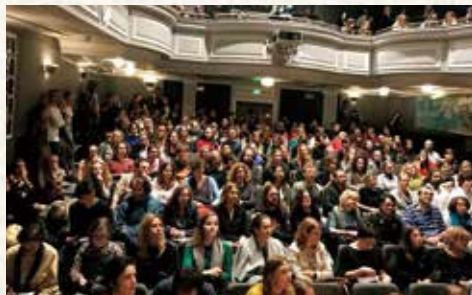
◀ 国交100周年記念イベントの一環で行ったポーランド公演は、全公演立ち見が出るほどの大盛況だった