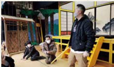
▲稽古を重ねて息のあった舞台をみんなで練り上げていく