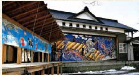
◀ 文化庁の補助事業で幕や衣裳を新調した