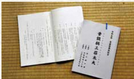
▲読みこまれた台本には書きこみも