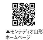
▲モンテディオ山形ホームページ

本市在住または在勤の方を対象にバックスタンド自由席の観戦チケットをお得な価格で販売します。試合日時／6月3日(土)午後2時キックオフ▼場所／NDソフトスタジアム山形(天童市) ▼対戦／清水エスパルス▼費用／一般1千500円、高校生以下無料▼チケット取り扱い／モンテディオチケット、NDソフトスタジアム当日券売場 閩市スポーツ振興課 スポーツ振興係 3-6651