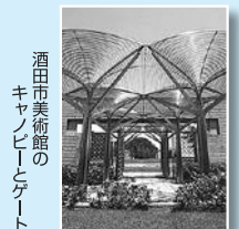
酒田市美術館の キャノピーとゲート