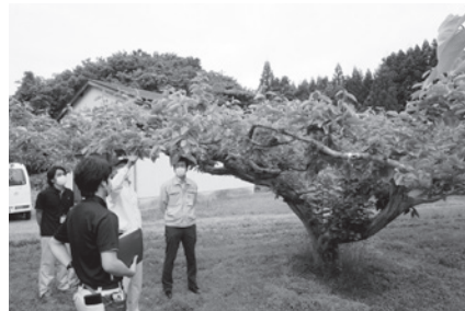
霜被害の状況調査

見を伺う。 市民の文化芸術活動の推進のための拠点である「場」は重要であり、その整備を、文化芸術推進計画が策定されたということからも前向きに進めるべきと考える。本市は、文化芸術における市民の参加を進めるために、市民ギャラリーの整備の方向性についてどのよ