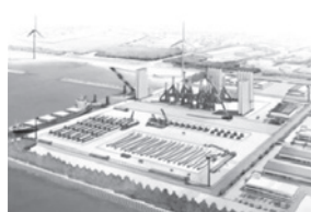
「基地港湾」のイメージ