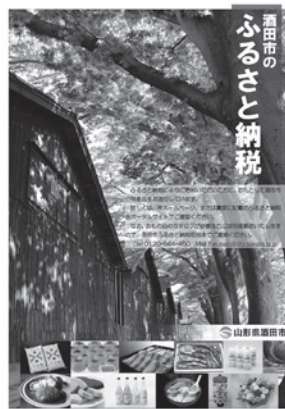
選ばれているふるさと納税

ついて」が出され、「生活保護問答集」については一部改正については扶養調査は「扶養義務の履行が期待できる」と判断される者に対して行うものと明記された。また、要保護者が扶養照会を拒んでいる場合は理由について丁寧聞き取りを行うことを求めている。本市での扶養照会はそのように行われているか伺う。