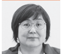
市原 栄子 議員

生活保護申請時の扶養照会とは生活困窮者が申請をためらう原因の一つになっている。国会で困窮者を生活保護制度から遠ざける扶養照会はやめるよう求めた質問に対し、厚生労働大臣は「扶養照会とは生活保護の申請の意思が示された場合、速やかに申請書を交付し、受理している。生活保護が申請された場合、文書などにより扶養義務調査を行うことを原則としている。今回の国の基準の改正では、判断基準が明確化され、国の通知を受け本市では、具体的な運用の変更を行い、扶養義務の履行が期待できない場合、照会を行わないなど、これまでの経緯など個別の事情に丁寧寄り添い判断している」 他の質問項目／学校給食の無償化を、国民健康保険税均等割の子どもへの課税の減免を