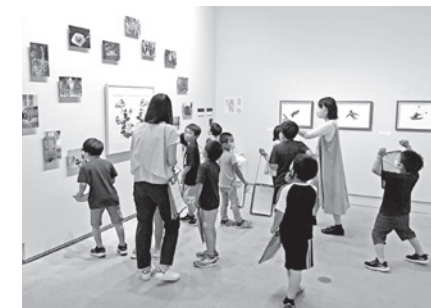
スクールプログラム

なれば、少し時間をいただき、判断していきたい。少しでも歳入を確保し、市民の期待に応えられるように、修繕のほうも頑張っていきたい。 他の質問項目／マイナンバーおよびマイナンバーカードの普及と活用