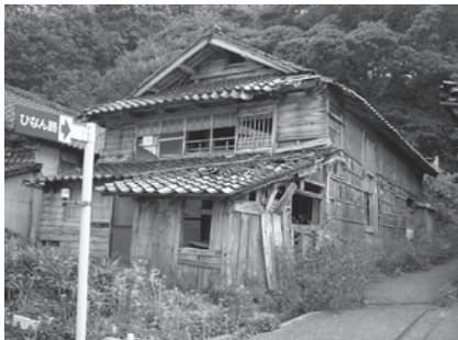
適正管理がなされていない空き家

代の入会が課題となる。支援は補助金の交付のほか、当市職員によるスタッフ協力や研修の実施などを行っている。 健康福祉部長 コミュニティ振興会と協働しながら、リーダー育成についても関係部局と連携し検討していきたい。 他の質問項目／消費者団体の復活支援、食改組織への支援