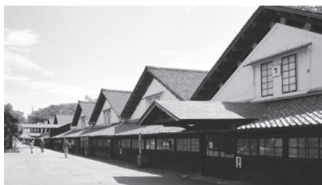
保存活用計画が策定される山居倉庫

ペースや在り方が課題となることも十分認識しており、同委員会の中でも議論となると考えている。その上で、商業高校跡地の利活用と併せて、駐車場の整備の在り方をしっかりと議論していきたい。 他の質問項目 酒田市風力発電事業の状況、営農型太陽光発電の考えと支援は