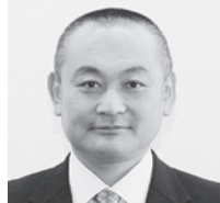
松本 国博 議員

策定をはずみとして、さかた文化財団には2つの美術館の運営だけでなく、充実した組織運営体制の利点を生かし、長期的視野に立つた企画の実施や文化芸術に携わる人材の育成など、市民の広範な文化芸術活動を支える専門機関となることを期待する。 他の質問項目／空き家等の現状と対策