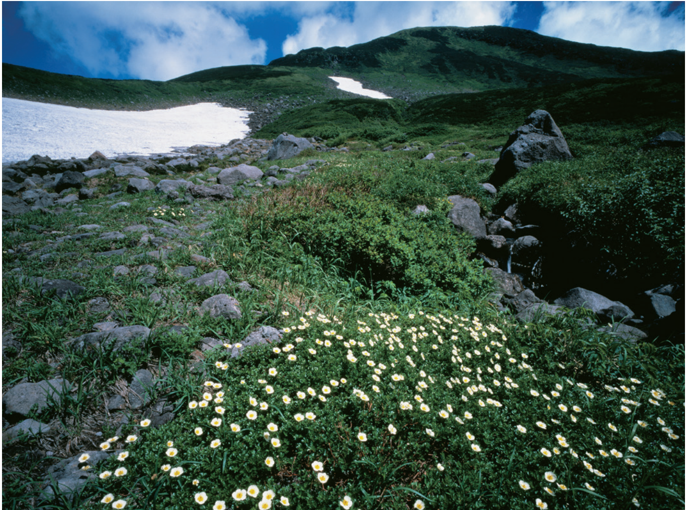
～名峰 鳥海山の四季～より 「河原宿からチングルマ群落と伏拝岳」(裏表紙に解説)