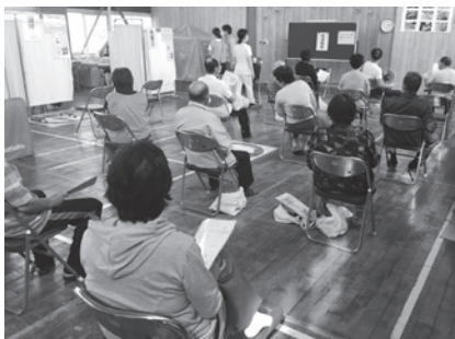
飛島地域のワクチン集団接種

の牧場により、地元の雇用創出に大きく寄与するとともに、地域畜産の収益向上に大きな影響を与えてくれるものと期待している。しかし、一方で環境問題について、心配をする声もある。し尿処理はバイオガス発電を行うようであるが、発生される液肥、消化液の処理による、草津川や数河の池の水質管理、また * デントコーン栽培で使用される大量の除草剤による、水生生物、猛禽類などの自然環境への影響をどのように考えているか所見を伺う。