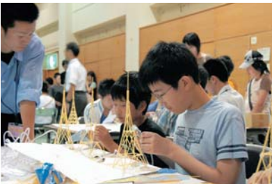
中村ものづくり科学教室

子どもたちが確かな学力を身につけることができるように、読書活動の推進や少人数指導など学習指導の充実に努めます。生活体験、自然体験、国内外交流、職場体験などの体験学習活動を充実し、自ら興味を持って学ぶ力や他を思いやる「公益の心」を育みます。また、地域の特色や人を生かし、子どもの個性を地域ぐるみで伸ばす教育を推進するため、家庭、学校、地域が一体となって教育活動の充実に努めます。