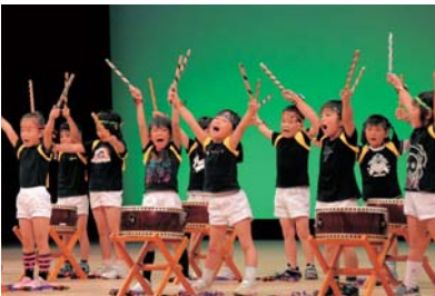
体験から成長へ（太鼓の発表会）

幼児期は、人間形成の基礎をつくる、とても大切な時期です。子どもたちの確かな成長に向けて、幼稚園や保育園における学びの充実を図るとともに、小学校も一体となって指導者の研修や情報交換、体験入学などを行うことにより、一貫して成長を支えることができる教育を推進します。