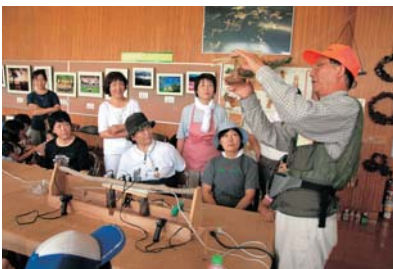
森林学習館での木工教室