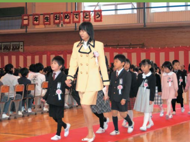
未来を担う酒田っ子たち