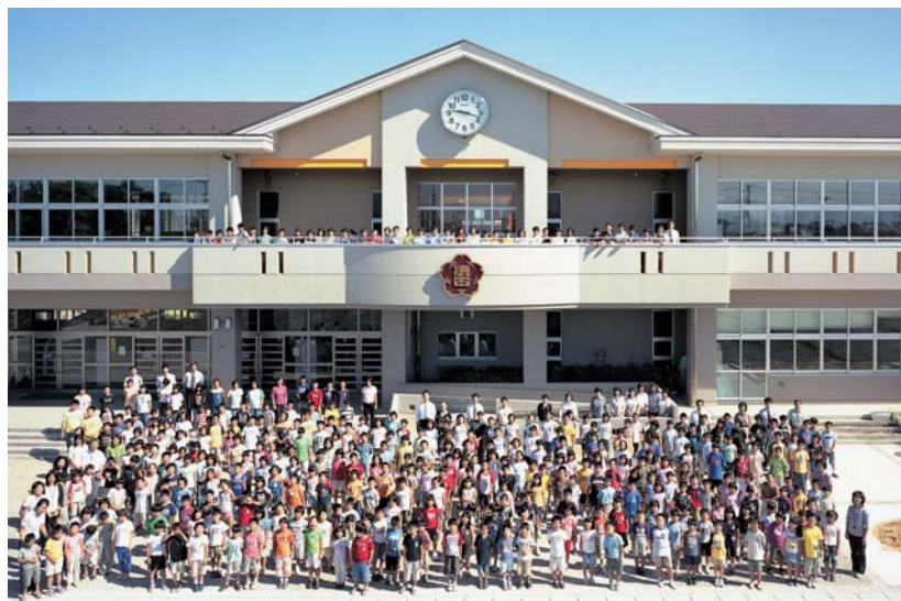
新築校舎の前で(浜田小学校)