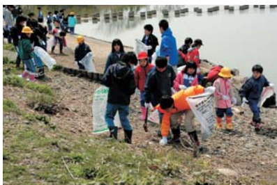
公益の心を育む体験学習