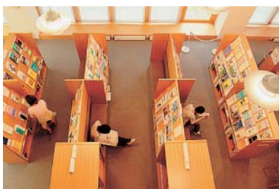
酒田市メディアセンター (東北公益文科大学 図書館)