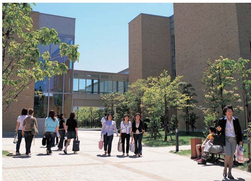
東北公益文科大学キャンパス