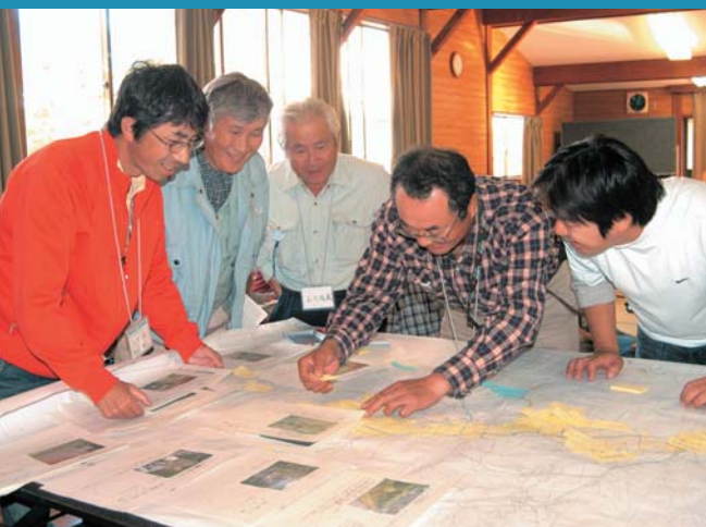
地域の良さを再発見、酒田ふるさと発見塾（中野俣）