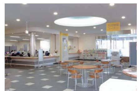
国際交流サロン(交流ひろば内)