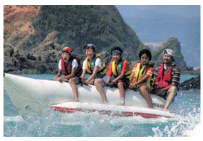
友好都市沖縄県東村との交流事業