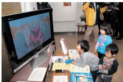
光ファイバーを使った地上デジタル放送