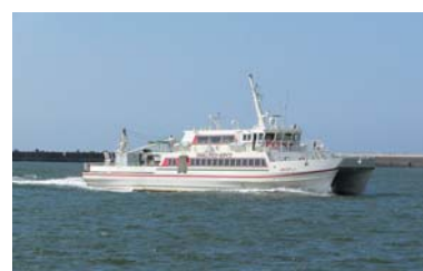
定期船ニューとびしま