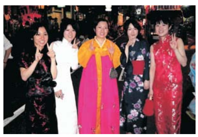
国際交流サロンでの活動

国内諸都市との交流については、連携、応援体制を強化するとともに、アンテナショップなどを活用した特産品の販路拡大と観光情報発信を推進します。