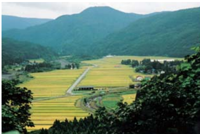
鳥海山の麓（升田地区）

地理的条件が厳しい中山間地域では、若年層の流出と急速な高齢化によって、地域コミュニティ機能を維持することが難しくなっています。公共施設や商店などへの交通機能、デジタルデバイス *40 、鳥獣、がけ地、豪雪など自然災害に対する安全確保といった中山間地域の課題解決を図ることにより、快適な生活環境づくりを進めます。地域コミュニティ機能が低下しないようNPO法人等市民団体と連携した地域振興を促進します。