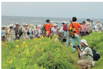
飛島ウォーキング大会