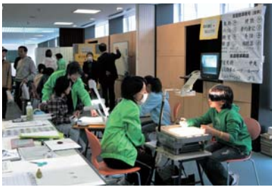
聴覚障がいを持つ人のための要約筆記ボランティア

市民活動の裾野を広げるため、関係団体と連携しながら、NPO法人やボランティアなどの自主的、自発的な活動の活発化を促進します。