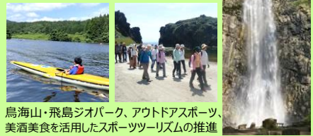
鳥海山・飛鳥ジオパーク、アウトドアスポーツ、美酒美食を活用したスポーツツーリズムの推進