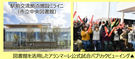
駅前交流拠点施設ミライニ（市立中央図書館） 図書館を活用したアランマーレ公式試合パブリックビューイング▲