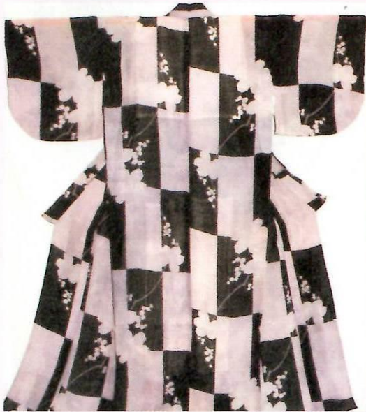
紫紗地葡萄模様小袖