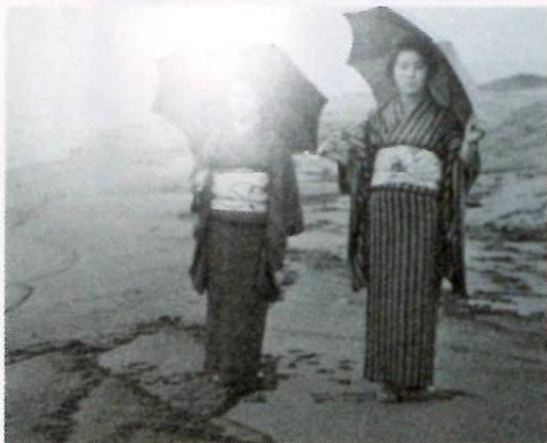
大浜海岸を散歩する女性(大正時代)