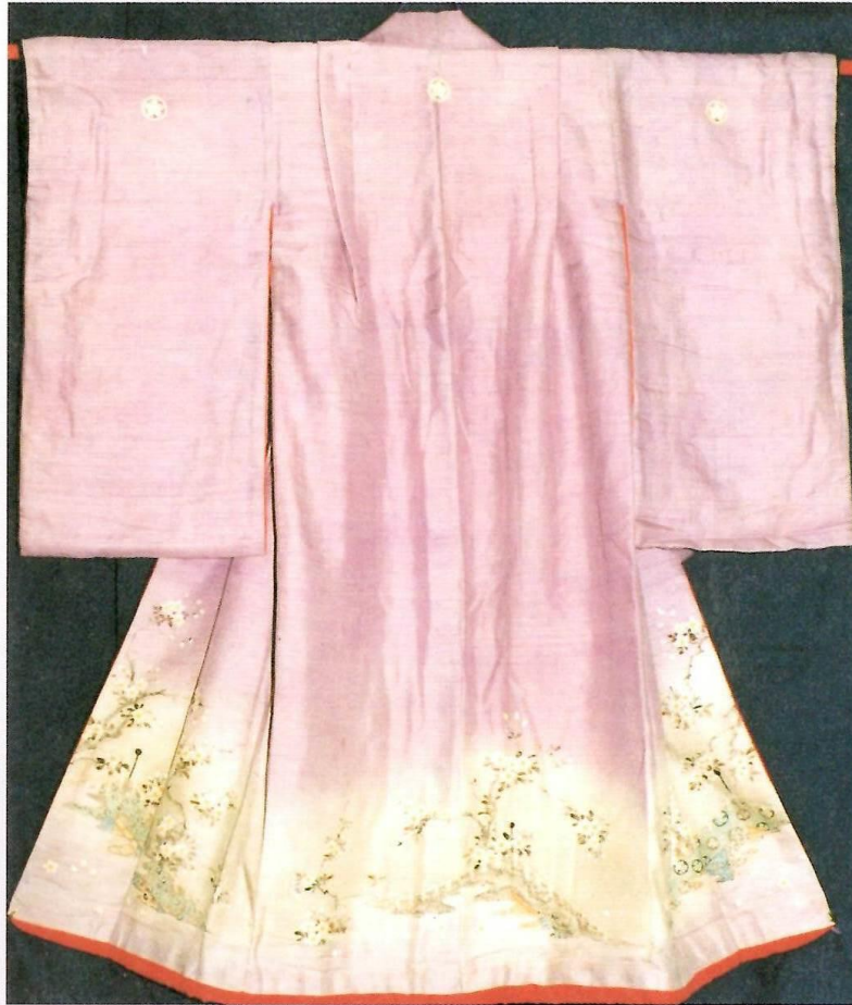
紫縮緬地枝垂桜模様振袖