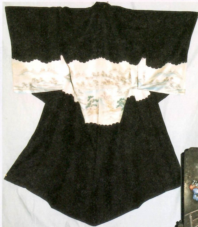
藍縮緬地梅花茅屋山水模様被衣