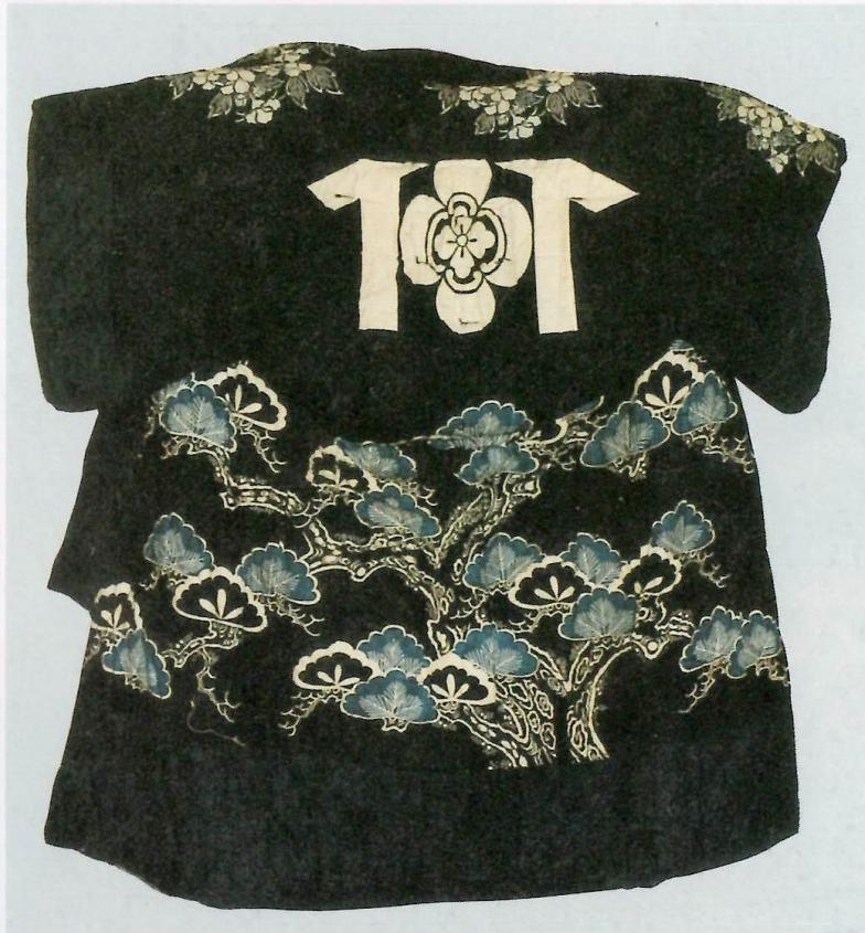
藍木綿地松牡丹庵木瓜紋模様夜着