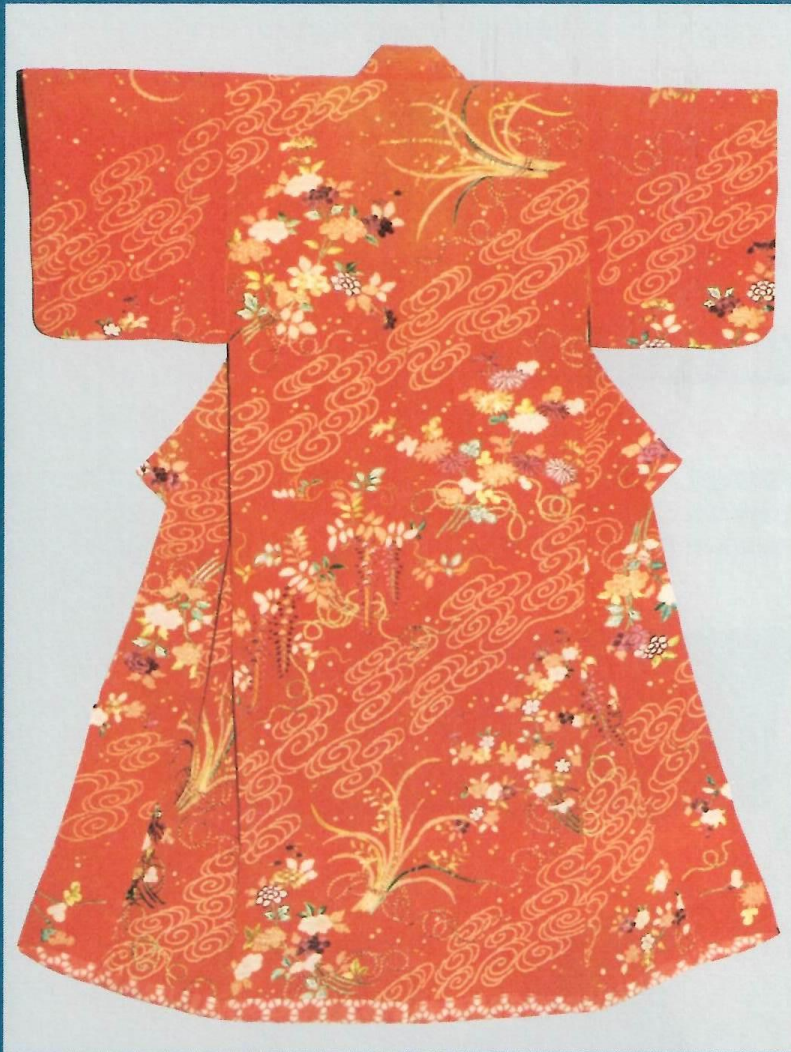
紅綸子地蘭藤菊牡丹流水花文模様小袖

開催期日 平成8年12月1日(日)～平成9年2月14日(金) 開館時間 午前9時～午後4時30分 休館日 毎週月曜日(当日祝日・振替休日はその翌日)12月29日～1月3日 入館料 大人100円 児童・生徒50円 65歳以上の方と身体障害者の方は無料