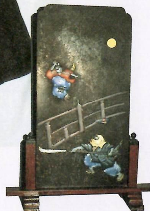
義経・弁慶五條大橋一騎打 (土蔵扉金具)