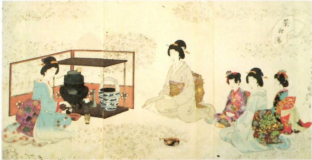
錦絵・茶の湯(周延画)