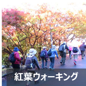
紅葉ウォーキング