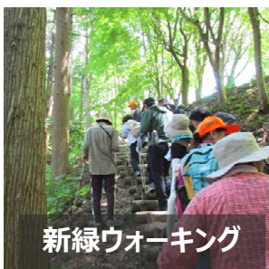
新緑ウォーキング