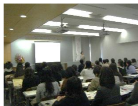
【市民フォーラムの様子】