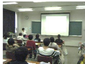
【デートDV防止講座の様子】