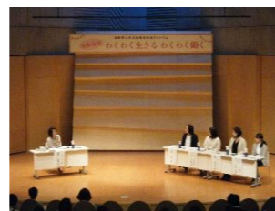
【市民フォーラムの様子】