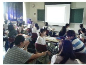
【デートDV防止講座の様子】