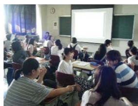
【デートDV防止講座の様子】