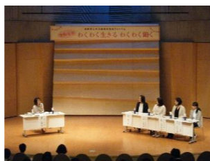
【市民フォーラムの様子】