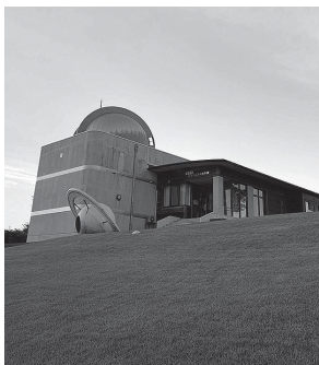
コスモス童夢外観