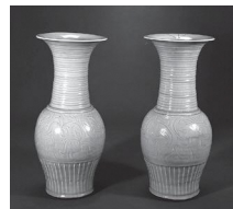
青磁牡丹唐草文大花瓶 山形県指定文化財