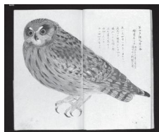
両羽博物図譜 フクロウ